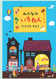
みんなのいちねん A4判 / 32巻 / 定価1760円