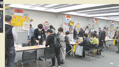
商談が進む児童書コーナー