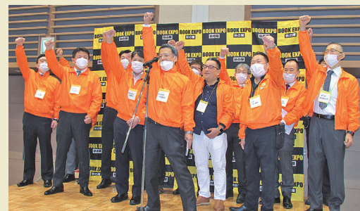
意気込みを示す実行委員会メンバー