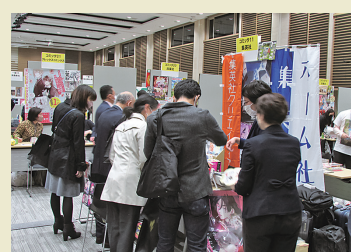
熱気に包まれる商談会場