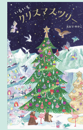
いろいろクリスマスツリー 31×19cm / 32巻 / 定価1540円