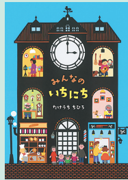
みんなのいちにち A4判 / 32巻 / 定価1650円