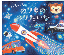
いろいろのりものりたいな 21×25cm / 32巻 / 定価1540円