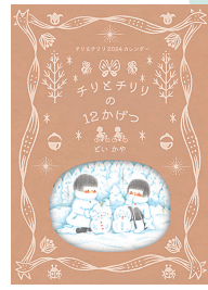
チリとチリリの12かげつ 24×17cm / 12巻 / 定価1320円

その他にも定番の絵本を多数をご用意しています。アリス館ブースへぜひお立ち寄り下さい。