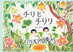
チリとチリリ 17×24cm / 32巻 / 定価1320円