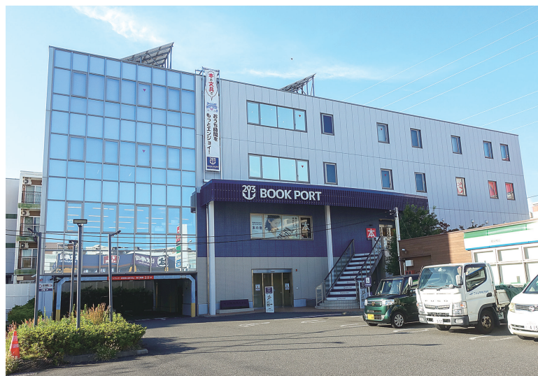
井上鋼材本社2階で営業する鶴見店