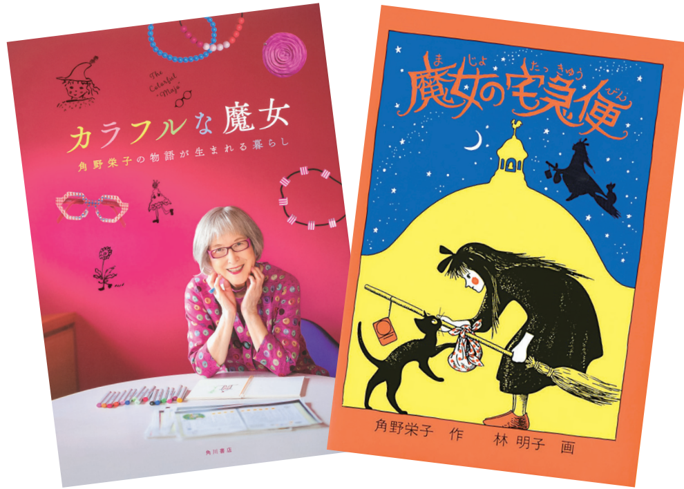
『カラフルな魔女 角野栄子の物語が生まれる暮らし』(KADOKAWA) 監修:KADOKAWA

公開される映画は、2020年から2022年にかけて「NHK Eテレ」で全10回にわたり放送されたドキュメンタリーをもとに新撮影・再編集、角野さんの日常を4年にわたって取材したものの。映画の公式ガイドブックがKADOKAWAから1月17日に発売された。