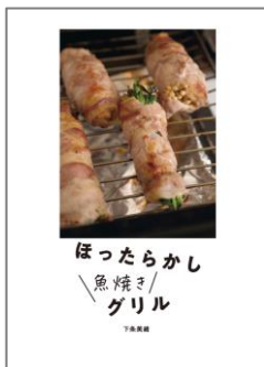
②ほったらかし魚焼きグリル おかず / 下条美緒 著