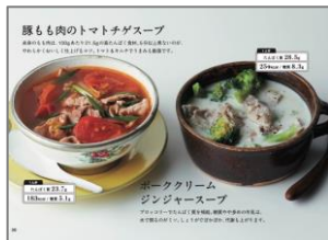
③たんぱく質たっぷり やせスープ 100 / エダジュン著