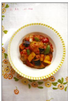
⑤軽い煮込みのイタリアン / 大島 節子著