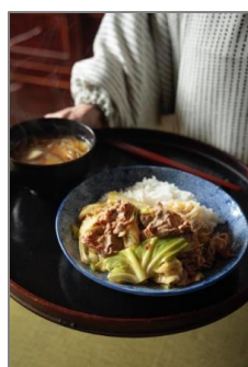
⑥横山タカ子の汁飯香 / 横山タカ子著