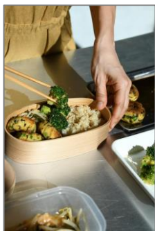
①からだを整う菜食 べんとう / 中島 美美枝著