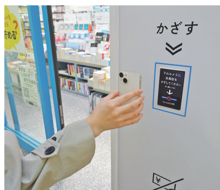
入退店時はスマートフォンで会員証をかざすとドアが開く

所在地:東京都千代田区永田町2-11-1 東京メトロ銀座線・南北線 溜池山王駅 営業時間:平日7:00～22:00、土日祝10:00～20:00