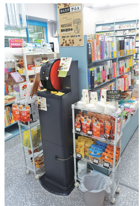
今年2月から5月までコーヒー無料サービスを実施