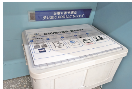
取り寄せサービスの商品を受け取るボックス