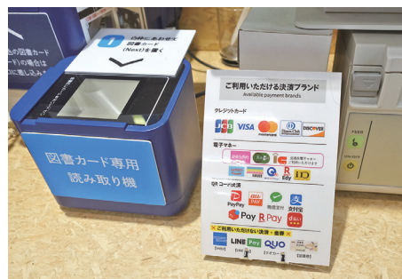
図書カードも含めた多様な決済手段に対応する