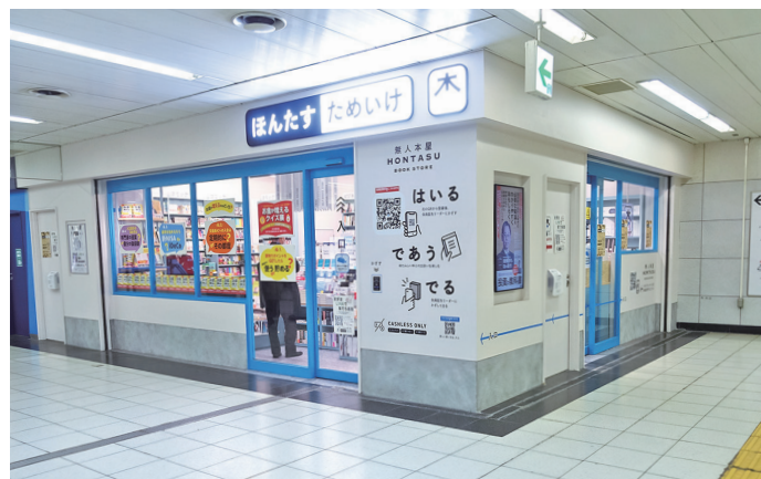
東京メトロ溜池山王駅の山王パークタワー側改札外(地上出口8番付近)にある店舗

入退店は、米RemoteLock社が開発し日本国内で構造計画研究所が提供するスマートロックおよびアク