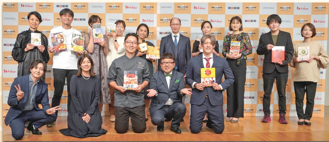
各受賞作家の集合写真