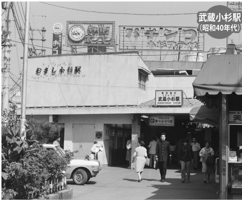
武蔵小杉駅 (昭和40年代)

B5判 176ページ 本体3400円+税 ISBN978-4-86598-910-6 C0026 ¥3400E