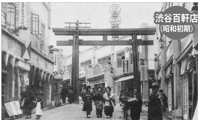
渋谷百軒店 (昭和初期)