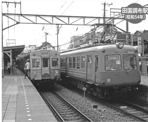
田園調布駅 (昭和54年)