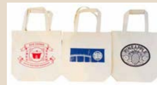
日台SUMMER FESTIVAL 2021ワークショップ | 2021.7