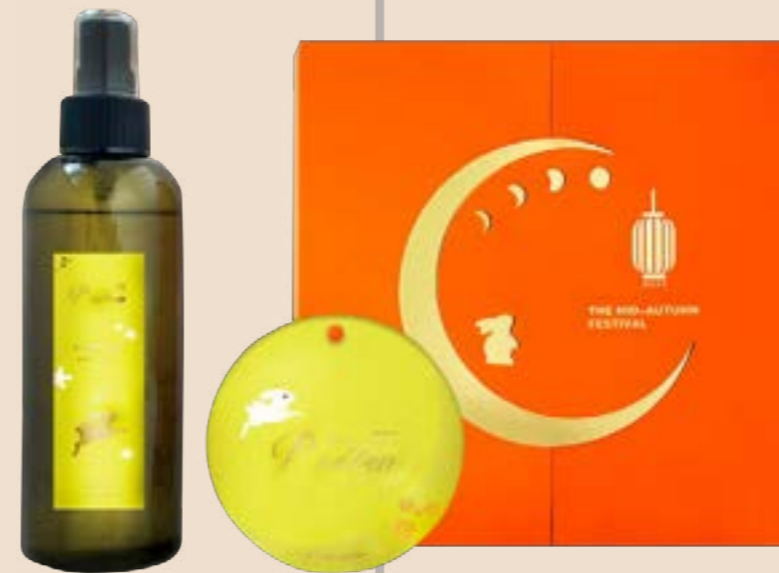
P.Seven 茶香水 文旦 アロマミスト ギフトBOX入り 9,680円(税込)

誠品生活日本橋開業 5周年を記念し、台湾の藍濃道具屋で作成した、人と時の流れや交差を表現した藍色です。 ● 9月中旬頃発売予定