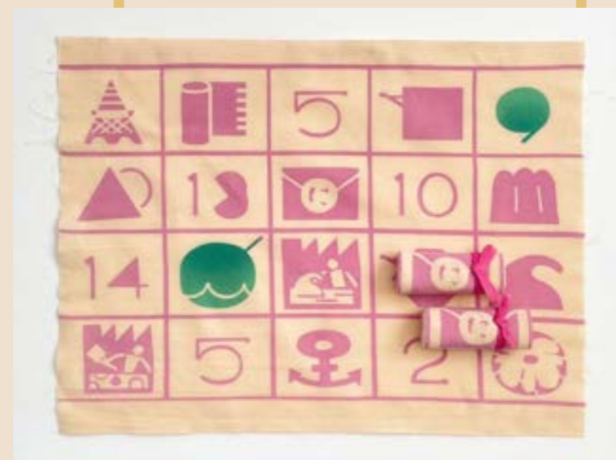
注染手ぬぐいにじゅら

DAYLILYの百合が立体的に飾られたナチュラルカラーの330mlマグカップ。お茶やスープにぴったりで、おうちでもオフィスでも大活躍。美しいルビー色のANNIVERSARY BEAU-TEAを添えて。