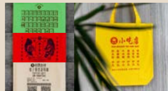
春節ワークショップ | 2023.1