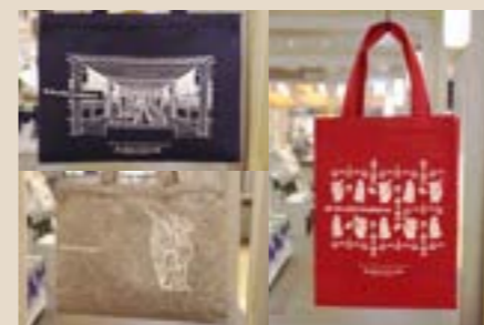
1周年記念ワークショップ | 2020.9