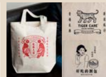
春節ワークショップ | 2022.2