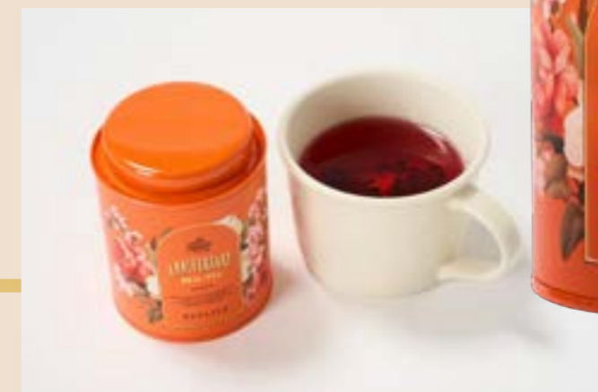
DAYLILY 夏も養生! 特製マグカップと ANNIVERSARY BEAU-TEA の贅沢セット 5,180円(税込)

月明かりが眩しい、柚子の香りと共に。5周年を記念し台湾で“柚子”と書いて縁起がいい文旦の秋の香り。 ● 9月18日(水) 発売